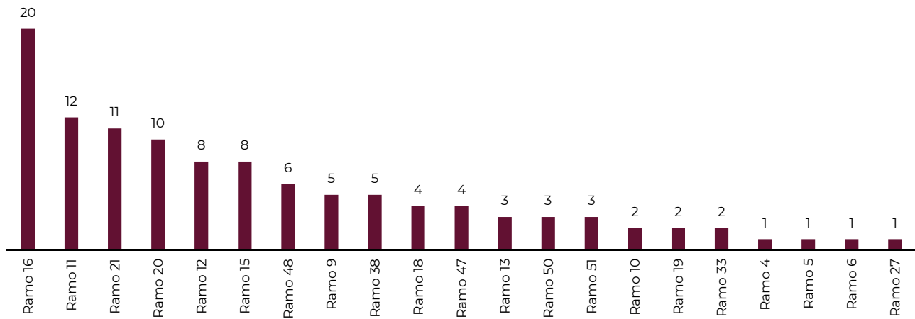
Gráfica 2. ASM concluidos por ramo en el primer trimestre de 2023