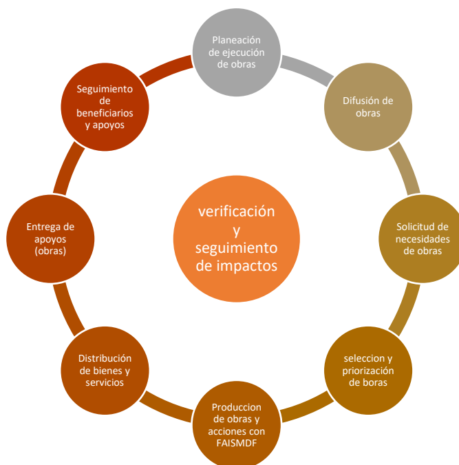
FIGURA 1. MODELO GENERAL DE PROCESOS SEGUIDOS

A pesar de la ejecución de obra, la valoración de ellas y de los mecanismos de seguimiento o prioridad a la selección de las obras, no se establece como parte de la operación del programa o de ejercicios anteriores. Sino mecanismos de fiscalización de las cuentas municipales; no se seguimiento a los impactos y beneficiarios. En consecuencia, los mecanismos de control y verificación, así como la satisfacción de usuarios, no son conocidos para seguimiento de las obras a mediano y largo plazo.